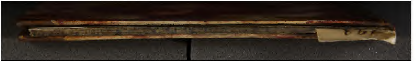
Early European Books, Copyright © 2009 ProQuest LLC. Images reproduced by courtesy of the Royal Library, Copenhagen. Hielmst. 193 4° (LN 1475 4° copy 2)